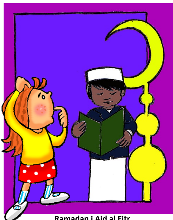
Ramadan i Aid al Fitr