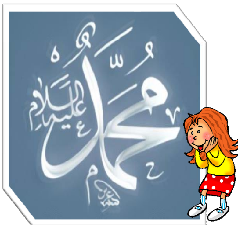
Kaligrafia, przedstawiająca imię proroka Mahometa