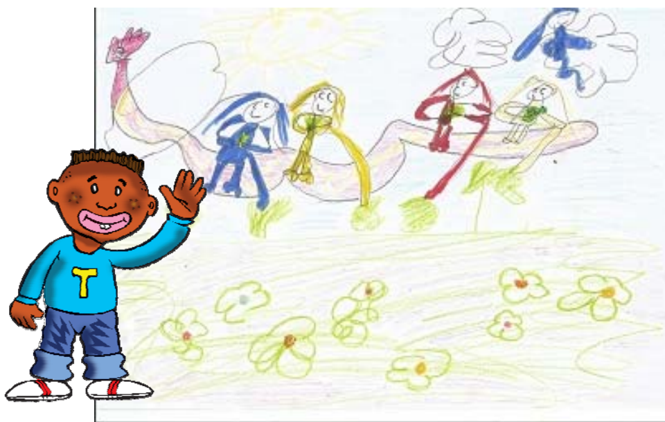
Matki Boskiej Zielnej (Maria na chmurce i dziewczęta z ziołami)