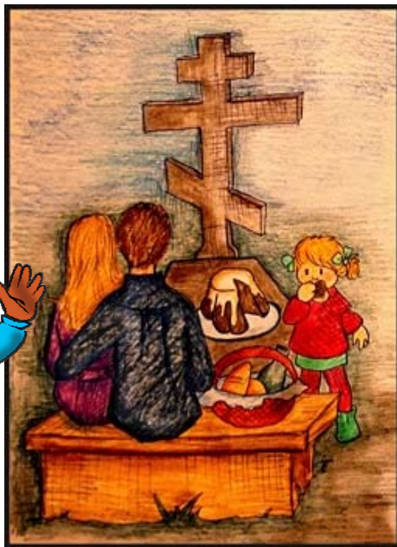
Radonica – prawosławne święto, upamiętniające zmarłych