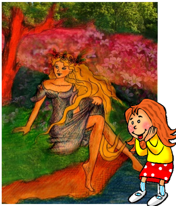
Rusałka (boginka) – centralna postać słowiańskich Zielonych Świąt