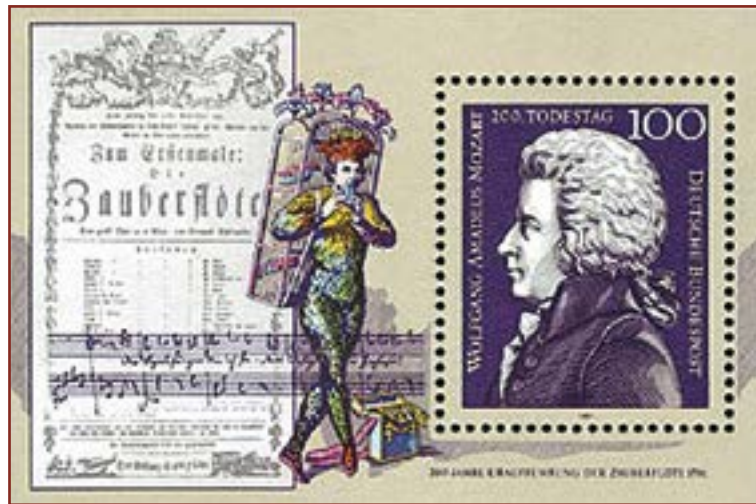
I'a 200 an Mozart

* Louïs Geisler e Alan Perroux , L'opéra, miroir du monde Festival d'Aix en Provence 2007- 2018.