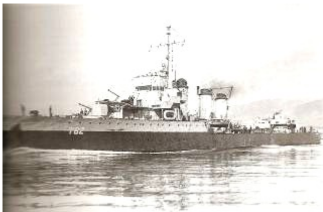
L'escorteur torpilleur Le SIMOUN

L'aéronavale était composée des flottilles 6F Catalina basée à Propriano en Corse et 4S, d'hydravions Walrus à Ajaccio.