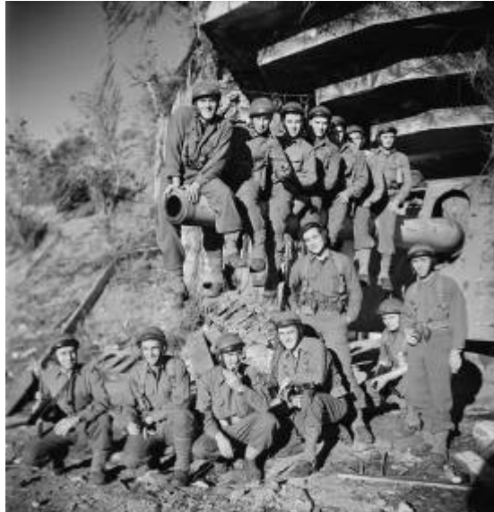
Commandos d'Afrique Devant une batterie allemande

Leur mission est de réduire en silence dans un premier temps les deux batteries allemandes du Cap Nègre. 75 hommes doivent débarquer et s'emparer des pièces de 155 mm, tandis qu'un autre groupe doit occuper la plage du Rayol avant l'arrivée des 680 hommes formant le dernier élément du Commando d'Afrique, qui devront ensuite se répandre et occuper les hauteurs.