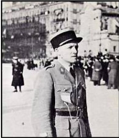
Capitaine Henry FRENAY

Les principaux groupes de résistance en R2 ont été constitué par Combat (capitaine Henry FRENAY en 1941), Libération (Emmanuel d'Astier de la Vigerie - 1940), Franc-Tireur - Jean Pierre Levy - 1941), d'autres mouvements et organisations se créant au fur et à mesure, comme les FTPF, les milices patriotiques etc.