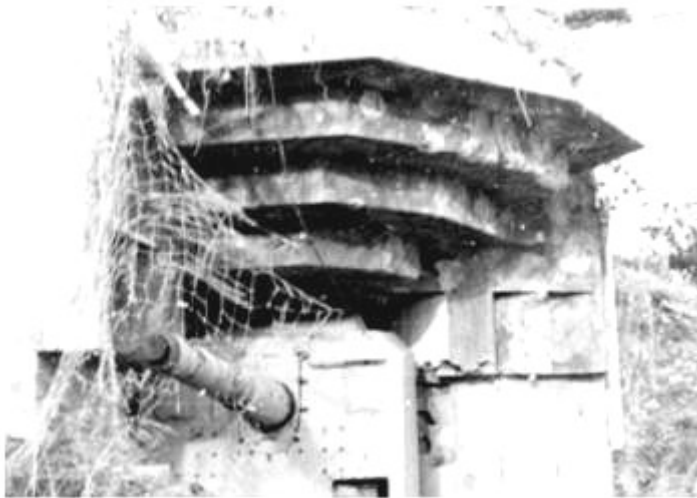
Marinekustenbatt Bunker à Toulon

Autant de points d'appuis qu'il faudra réduire non sans pertes humaines.