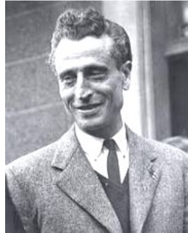
Emmanuel d'ASTIER de la VIGERIE

A partir de 1943 on assiste à la constitution de maquis dans l'arrière pays, maquis qu'il faudra organiser, armer et faire vivre par des parachutages de matériels. La création des Mouvements Unis de la Résistance - Les MUR - va donner un élan nouveau à cette résistance qui va fournir de plus en plus de renseignements sur l'implantation des forces allemandes, leurs mouvements et les constructions des fortifications.