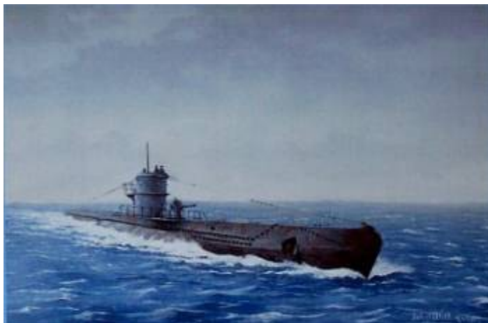
U. BOAT – U 36