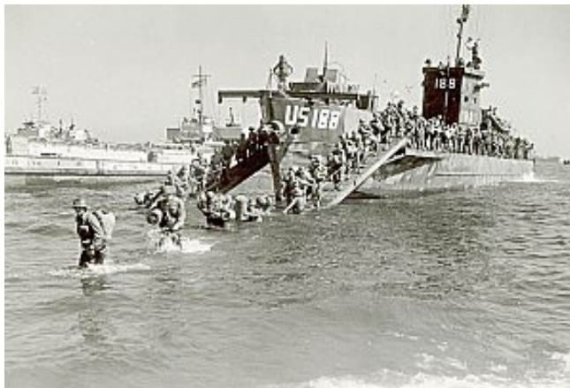
Débarquement à Cavalaire

Le rivage est à la fois la cible des chasseurs bombardiers, puis de l'artillerie navale qui s'en prend directement aux ouvrages défensifs, et des lance-roquettes multiples à bord de LCT qui eux tirent sur les plages.