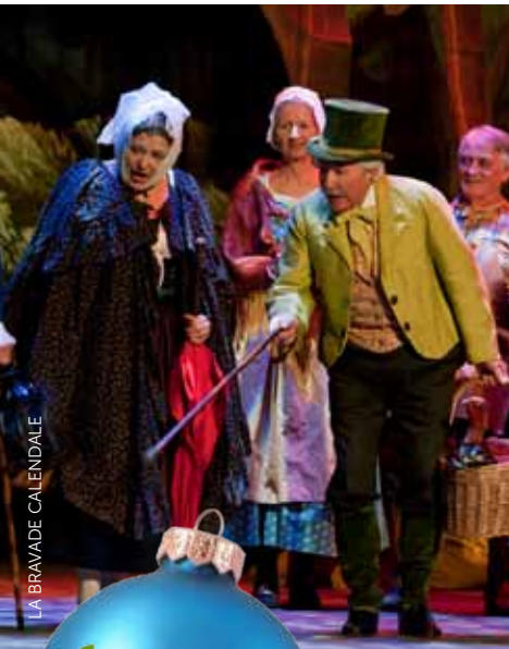
LA BRAVADE CALENDALE

Veillée calendale : repas de Noël provençal traditionnel animé de musiques, chants et danses folkloriques par Farandoulaire Sestian.