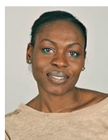
Afi HUKPORTIE Projets Urbains