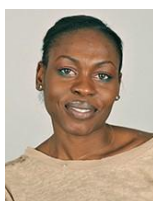
Afi HUKPORTIE Projets Urbains