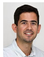
Henri MALZAC Systèmes