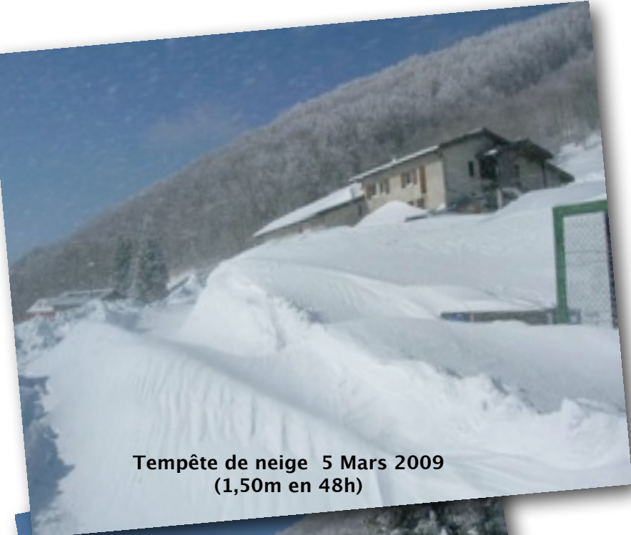
Tempête de neige 5 Mars 2009 (1,50m en 48h)