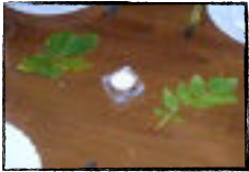
Une ambiance familiale et conviviale