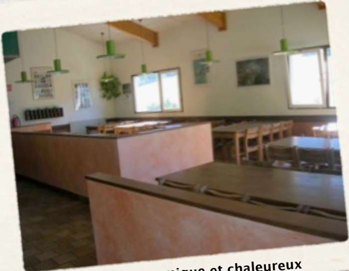
Un espace panoramique et chaleureux