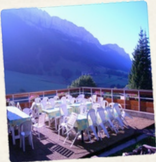
La terrasse panoramique