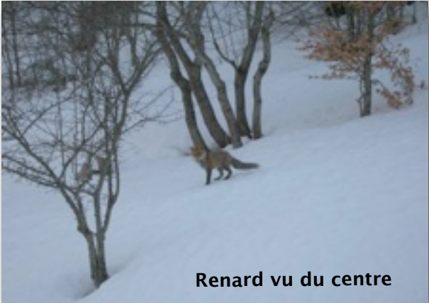
Renard vu du centre