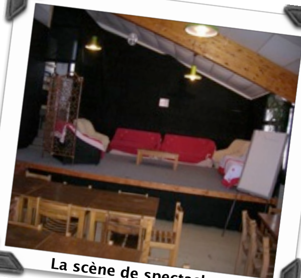
La scène de spectacle