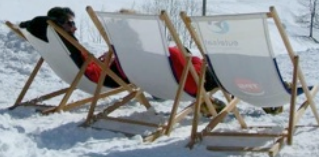
Un espace détente extérieur (avec vue sur une partie des pistes alpines)