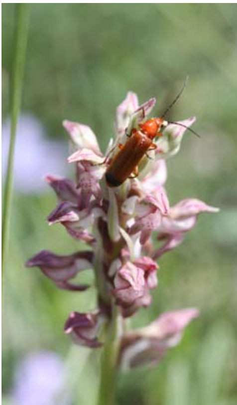
Anacamptis fragrans à Gajan une découverte de l'Œil Vert

Par ailleurs, nous avons été contacté par la ville d'Anduze pour donner une conférence sur la zone NATURA 200 et la Trame Verte et Bleue. Repoussée à deux reprises, cette conférence prévue dans le cadre de la Fête de la Nature et des 50 ans du Parc National des Cévennes a été finalement renvoyée au printemps 2021.