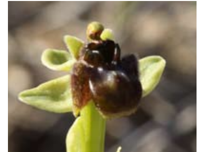
Découverte par l'Œil Vert d'une seconde station d'Ophrys bombyliflora pour le Gard (Gajan)

• Mercredi 16 décembre : « Initiatives citoyennes et éducation à l'environnement, ensemble pour la transition écologique ! »