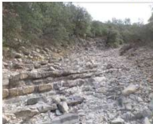
Dans le lit du Teulon