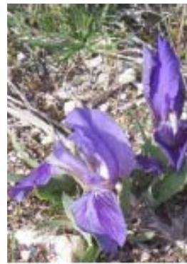
Iris des garrigues