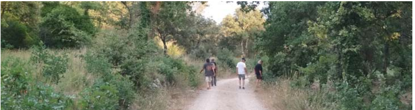
Promenade de «déconfinature» à Bernis, le 10 juillet

Les restrictions de déplacement ont aussi conduit la salariée de l'Œil Vert à affiner les inventaires naturalistes dans les zones proches de son domicile et plusieurs espèces peu communes, dont une extrêmement rare en France, et dans notre département en particulier, ont été mises en évidence. Ces observations ont été transmises à l'Observatoire de la nature dans le Gard et ont fait l'objet d'une communication auprès du Conservatoire des Espaces Naturels et du grand public, via notre blog.