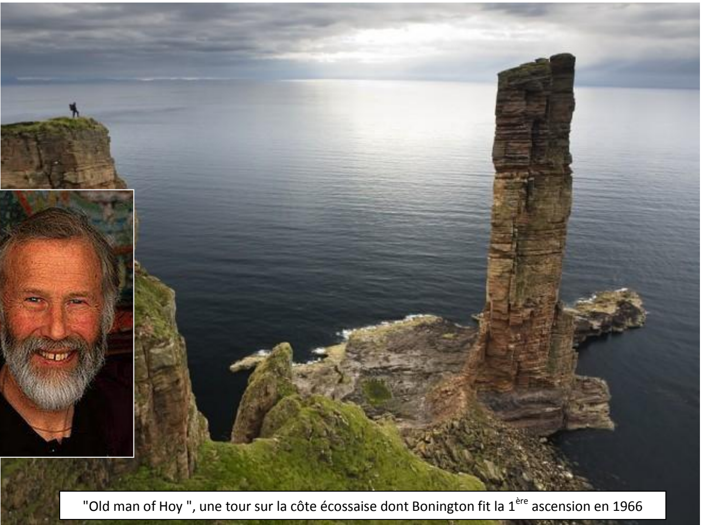
"Old man of Hoy ", une tour sur la côte écossaise dont Bonington fit la 1 ère ascension en 1966

Un projet de l'école d'aventure du CAF Grenoble-Isère