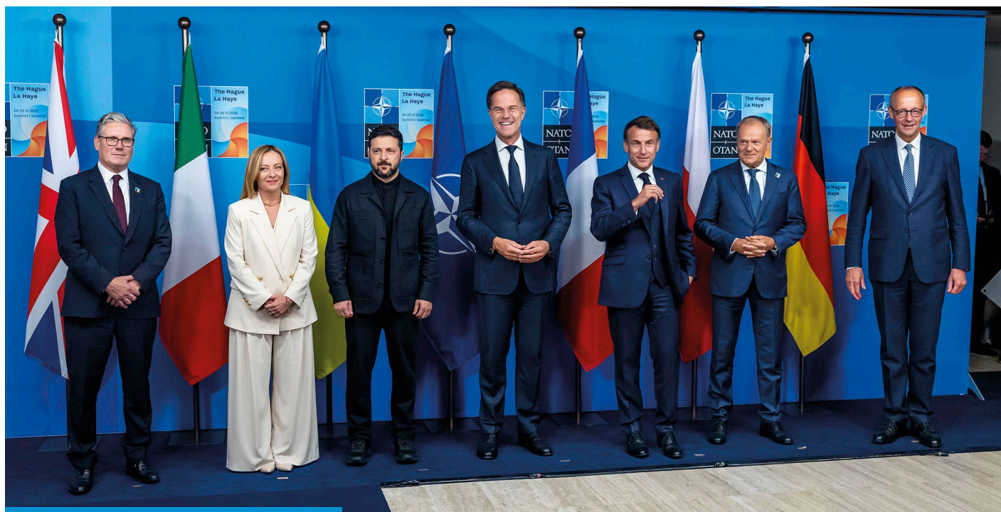
Le sommet de l'OTAN de la Haye (25 juin 2025).

Comme dans certains pays qui évitent de communiquer sur les financements européens, la France évite de communiquer sur l'OTAN alors qu'elle intègre les besoins opérationnels et techniques, en regardant ce qu'il se fait déjà sans chercher à travailler sur une page blanche, comme par exemple avec Tide Sprint, et avec des centres de simulation. Loin d'être un « truc » fumeux, le terme NATO by design est bien difficile à entendre par un Français. On le comprend mieux en entendant les états-majors européens dire que « l'OTAN nous demande » certaines structures opérationnelles, auxquelles il faut bien entendu fournir aussi du matériel. Les Battlegroups sont presque bâtis comme autrefois quand par exemple Napoléon utilisait la cavalerie légère polonaise en Espagne, César la cavalerie lourde des Germains contre les Gaulois.