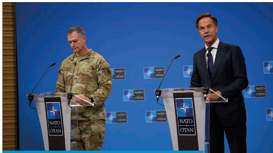
Conférence de presse du général de corps aérien Alexis G. Grynkeuich (US), SACEUR et de Mark Rutte, secrétaire général de l'OTAN.

le Royaume-Uni, deux pays très fortement liés aux États-Unis, l'un ayant peut-être pris le relais au sein de l'UE, ce qui ne signifie pas que les autres ne le sont pas. L'Allemagne y prend un rôle désormais important, au point de s'y valoriser désormais comme dans l'UE, notamment par consensus, principe de l'OTAN, quand la France aime trancher, disant qu'elle doit réapprendre de la France dans le domaine militaire mais que la France devrait apprendre de l'Allemagne comment travailler au sein de l'OTAN surtout dans cette phase de réarmement face à la Russie et pourquoi pas face à la Chine.