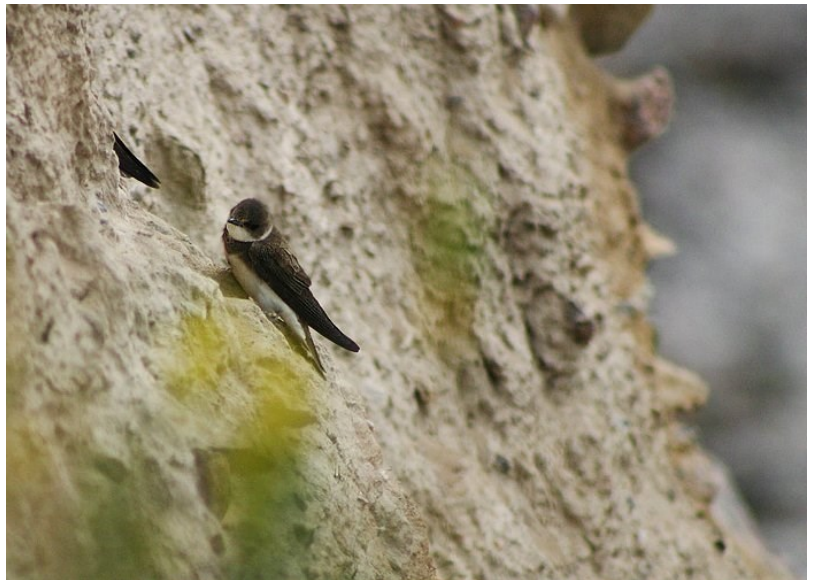
Les hirondelles de rivage nichent sur Dumet

Retenez déjà cette date .... Les documents permettant de participer à cette AG seront transmis à nos adhérents, comme habituellement, début juillet.