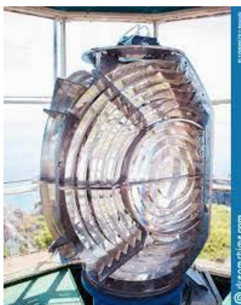
Lentille à échelons

Il est nommé secrétaire de la Commission des phares et est admis à l'Académie des sciences. De constitution fragile, il est malheureusement atteint par la tuberculose et meurt en juillet 1827 à 39 ans.