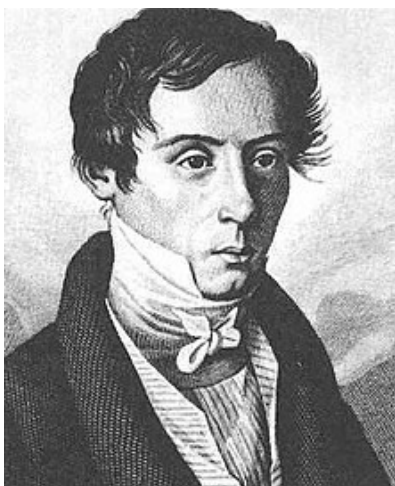
Augustin-Jean Fresnel (1788-1827)

Augustin Fresnel est né en mai 1788 en Normandie, après des études à l'Ecole centrale de Rouen, il entre à l'Ecole des Ponts et Chaussées en 1806 et en sort ingénieur. Il rejoint le corps des Ponts et Chaussées où il restera toute sa courte vie. Très attiré par la recherche, il mène des travaux scientifiques qui le conduisent à s'intéresser à la diffraction de la lumière. Or en 1819 il est nommé à Paris à la Commission des phares.