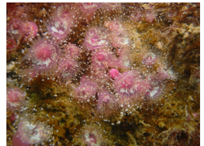
anémone bijou