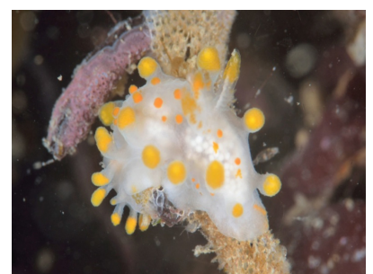
limace clavigère-3 cm