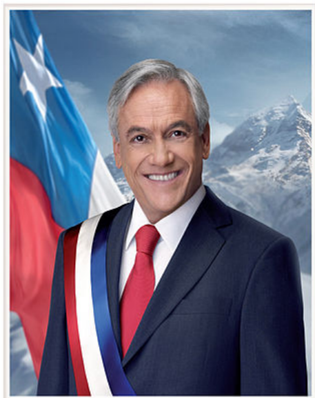
SEBASTIÁN PIÑERA ECHENIQUE PRESIDENTE DE LA REPÚBLICA DE CHILE