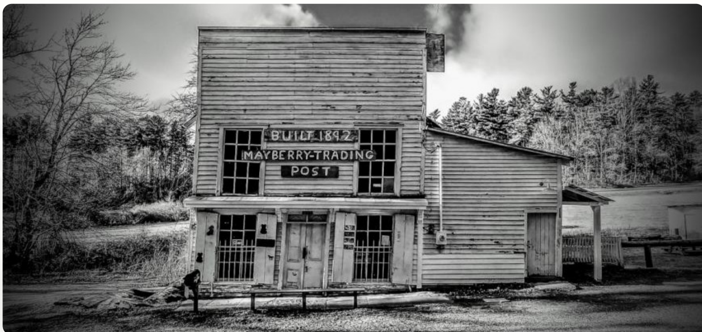
Mayberry Trading Post © Virginia Tourism Corporation.

Les membres de la clique qui obtiennent un Succès en Perception surprennent Spotswood, sa famille et les autres employés en train de jeter des regards suspicieux dans leur direction.