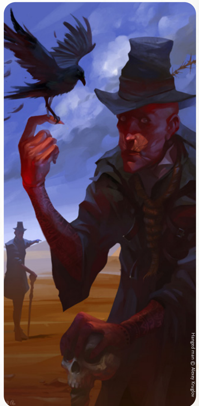
Handged man © Alexey Kruglov

🔫 Winchester 73 : Tir d6, 24/48/96, 2d8-1 PA 2, 15 coups.