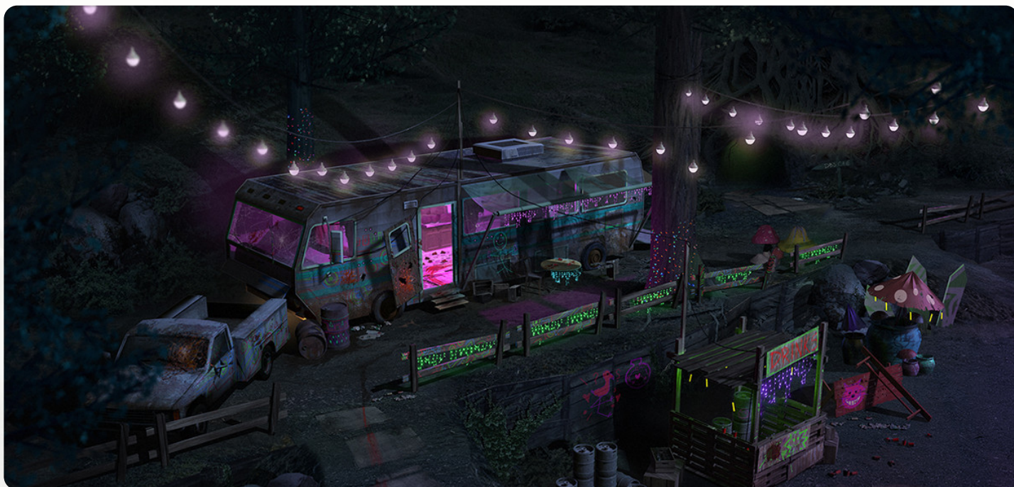
Rave in the Redwoods, 2017

Il ne souhaite pas mourir, mais il est terrifié par ce qu'il deviendra si son plan est mis à jour. Il s'enfuit s'il est clair qu'il ne peut pas gagner, laissant ses zombies occuper les héros. Si Jimmy ne renouvelle pas le rituel de zombification, les zombies « meurent » à nouveau 24 heures plus tard, laissant peu de preuves que quelque chose clochait.