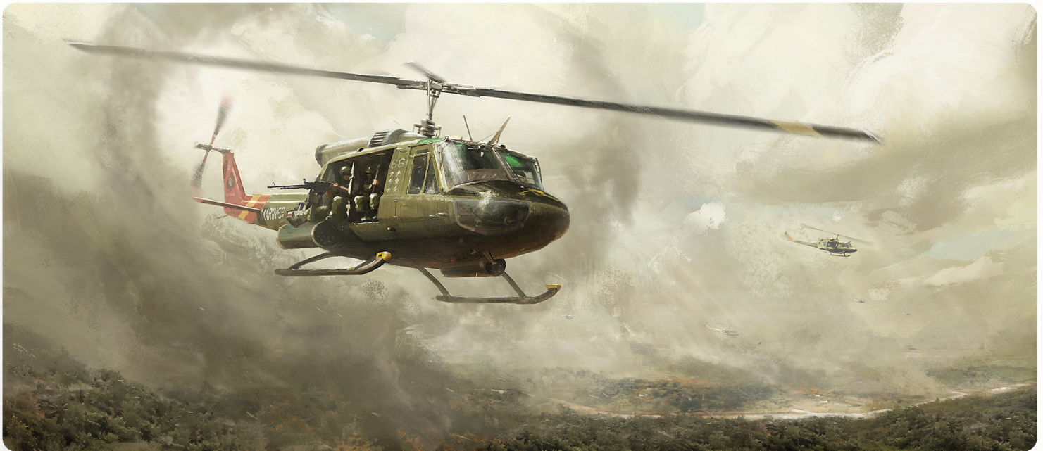
Ride of the Valkyries © 2016, Patrik Rosander

en pierre. La sculpture semble avoir été récemment défigurée avec une machette et élaboussée de sang frais.