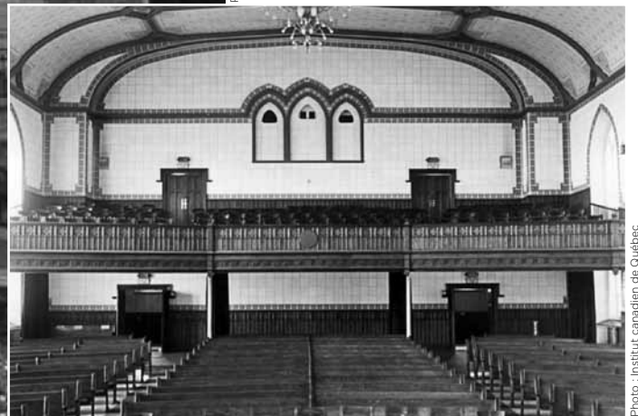
Photo : Institut canadien de Québec (avant le réaménagement en bibliothèque)