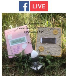
Pochettes à élastiques