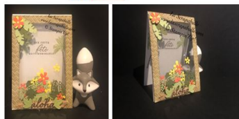
Une carte à secouer en transparence