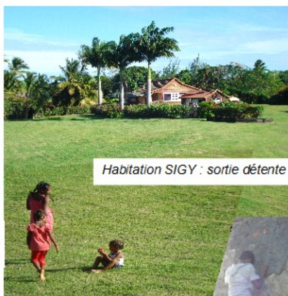
Habitation SIGY : sortie détente