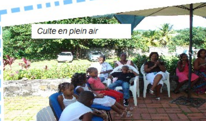
Culte en plein air