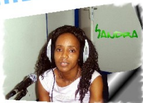
Émission radiophonique A contre courant