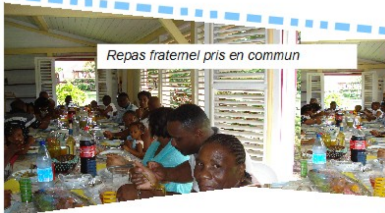
Repas fraternel pris en commun

Nous vous proposons de revenir en image sur quelques uns des événements qui ont marqués l'actualité de l'association en 2009