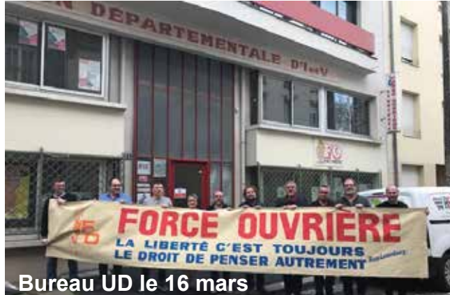
Bureau UD le 16 mars