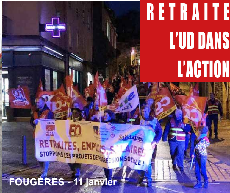
FOUGÈRES - 11 janvier