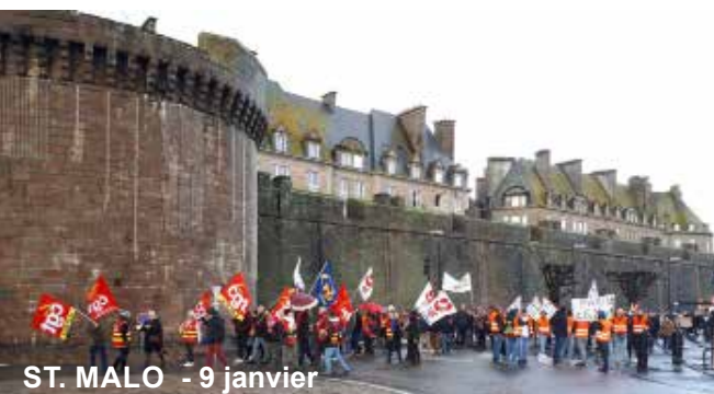
ST. MALO - 9 janvier

Grève du 9 janvier. À REDON, des entreprises bloquées et la collecte des déchets perturbée