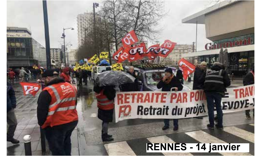
RENNES - 14 janvier