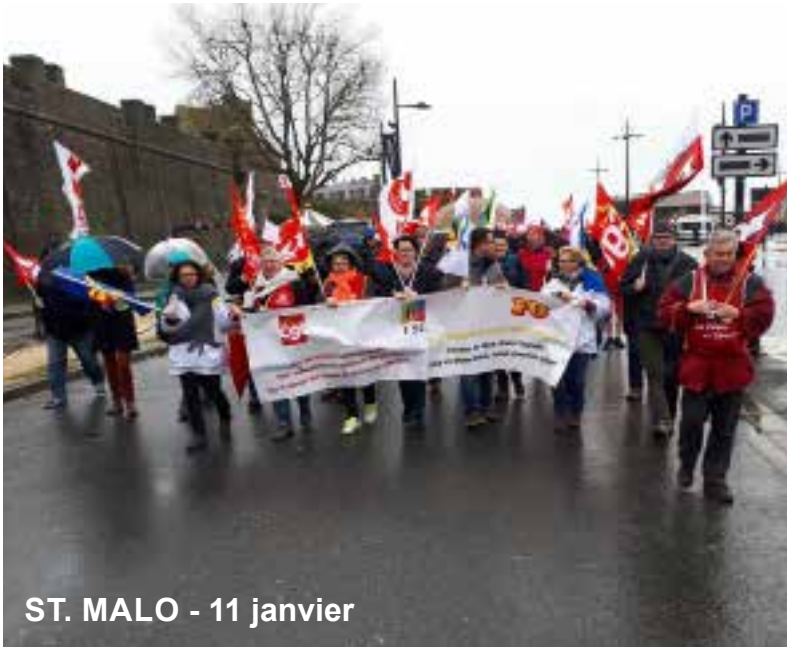
ST. MALO - 11 janvier