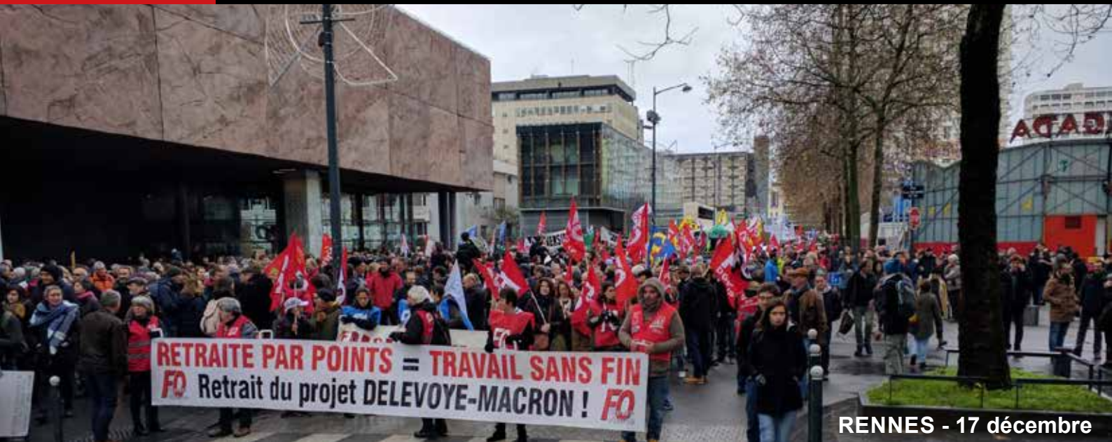
RENNES - 17 décembre