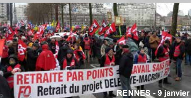
RENNES - 9 janvier