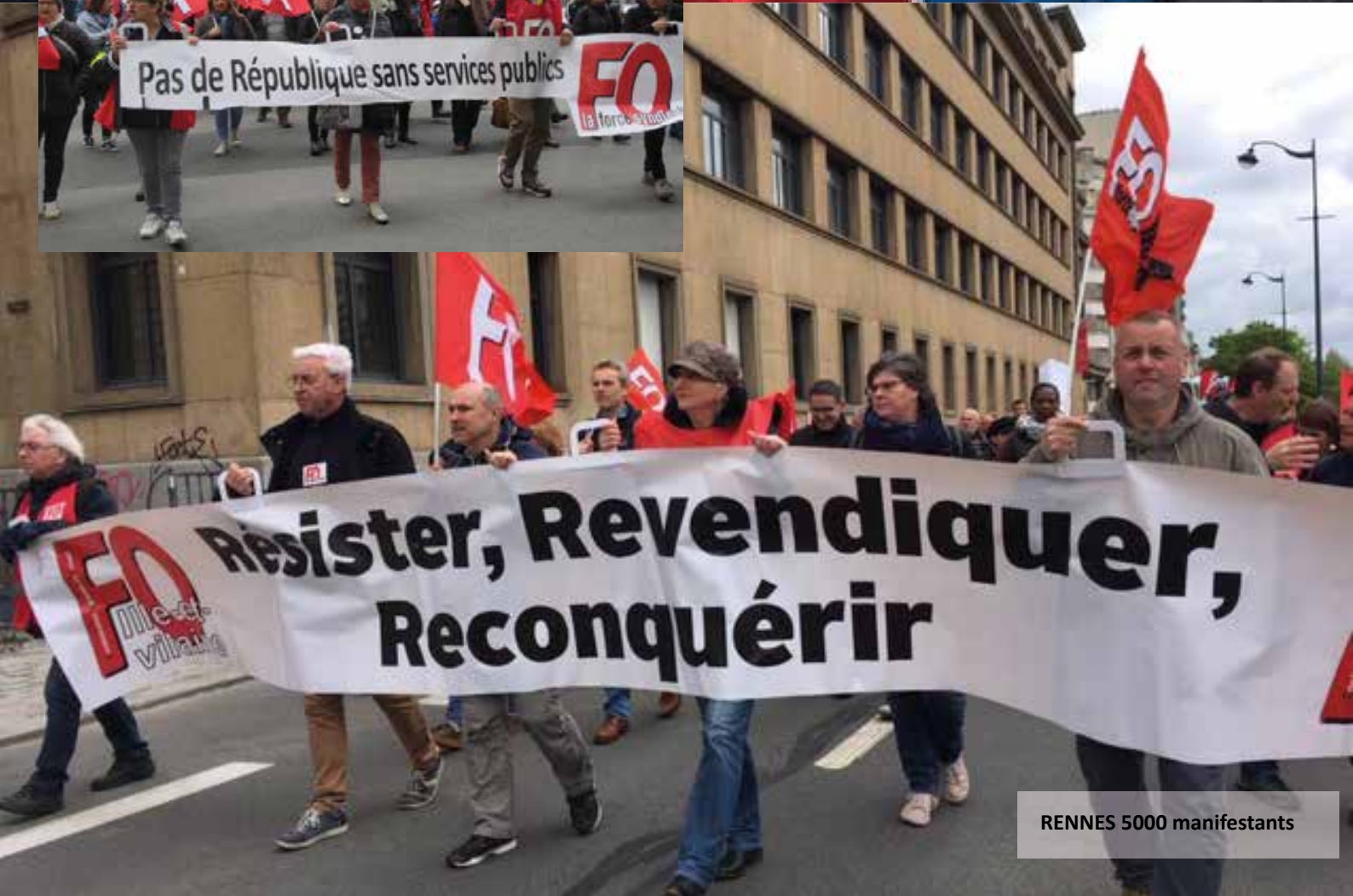
RENNES 5000 manifestants