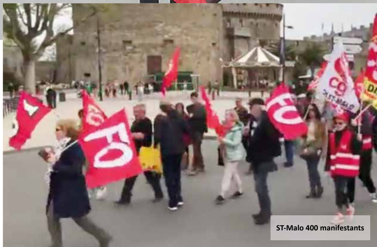
ST-Malo 400 manifestants