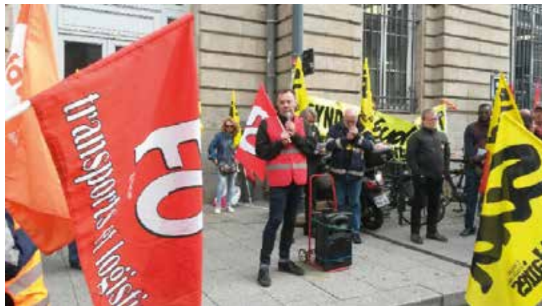
Rassemblement des facteurs en grève vendredi 17 mai contre l'ubérisation de leur travail.