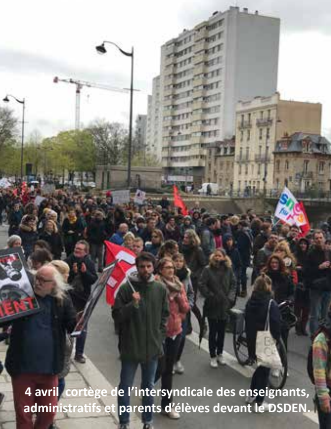
4 avril cortège de l'intersyndicale des enseignants, administratifs et parents d'élèves devant le DSDEN.