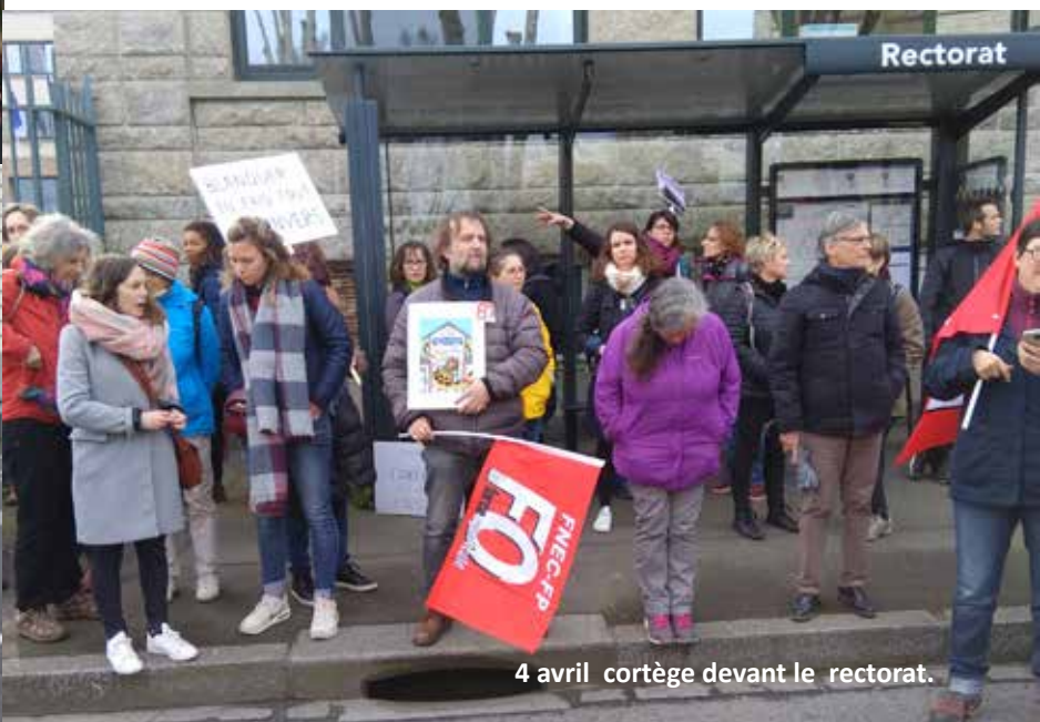
4 avril cortège devant le rectorat.