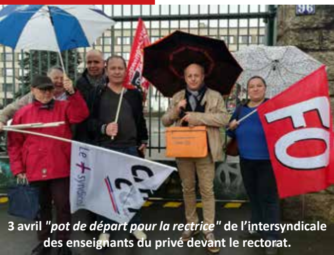
3 avril "pot de départ pour la rectrice" de l'intersyndicale des enseignants du privé devant le rectorat.

Les réformes du lycée et du baccalauréat sont elles aussi dans le collimateur du personnel enseignant, qui demande « leur abrogation et l'annulation des suppressions de postes prévues dans la Fonction Publique ».