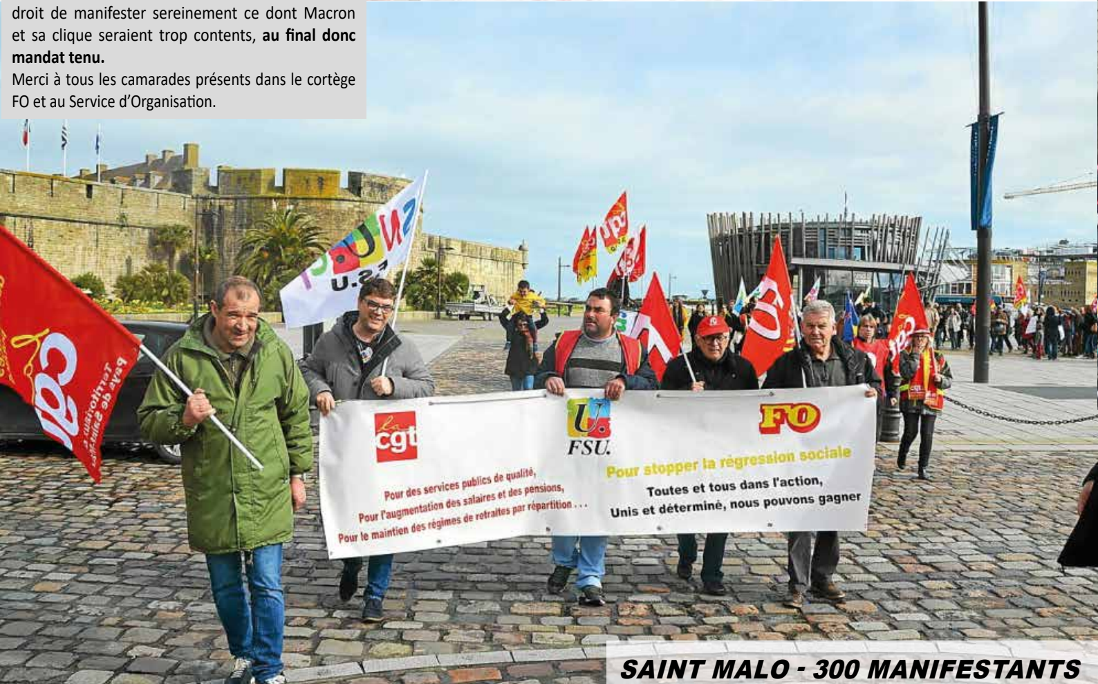
SAINT MALO - 300 MANIFESTANTS