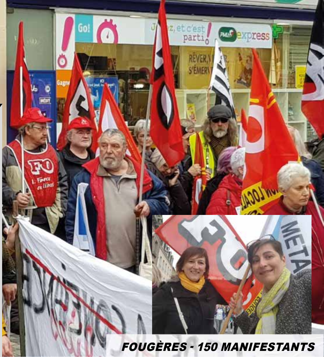
FOUGÈRES - 150 MANIFESTANTS

Merci à tous les camarades présents dans le cortège FO et au Service d'Organisation.