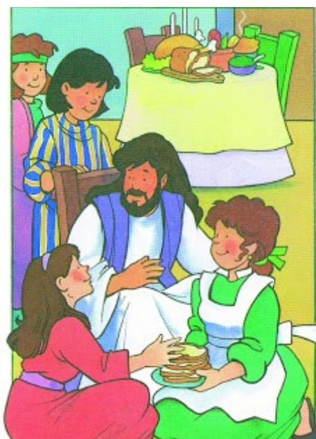
« Une seule chose est nécessaire. Marie a choisi la meilleure part : elle ne lui sera pas enlevée. »