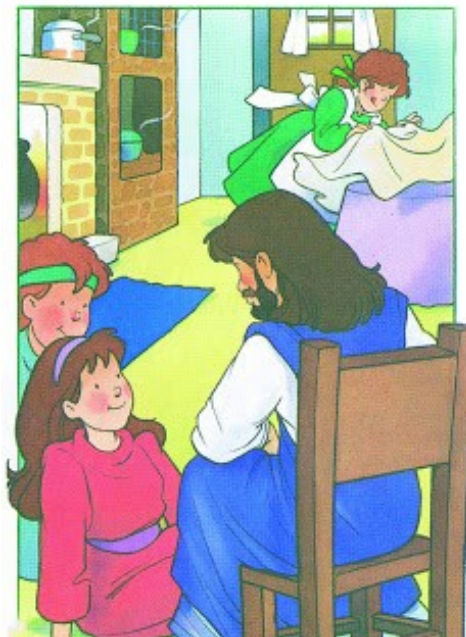
Un jour, Jésus s'arrête chez elles.