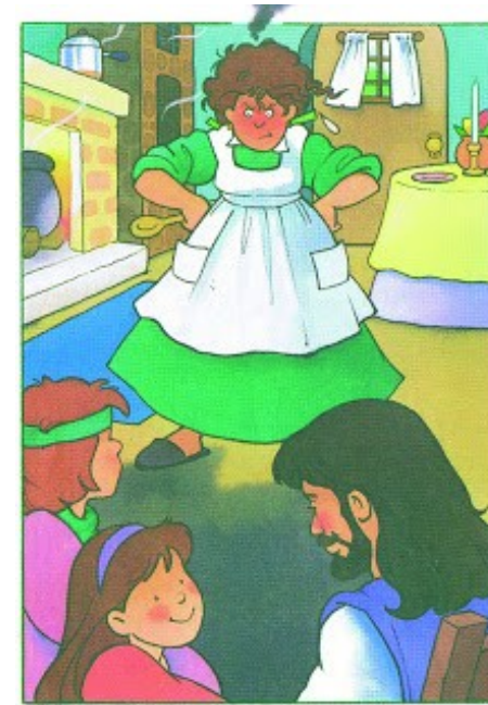
Marthe interpelle Jésus : « Seigneur, cela ne te fait rien que ma sœur me laisse faire le service toute seule ? Dis-lui donc de m'aider ».