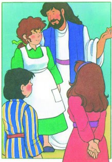
Jésus lui répond : « Marthe, Marthe, tu t'inquiètes et tu t'agites pour bien des choses ! »