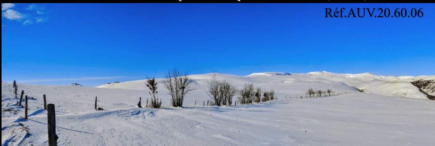
La vallée de Brezons depuis le Cirque de Grandval (Cantal)