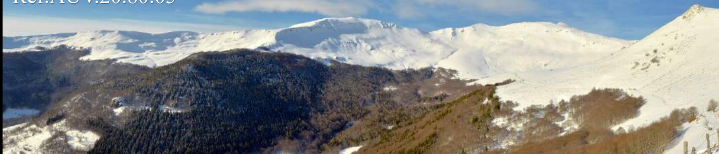
Cirque de Grandval, Cantal