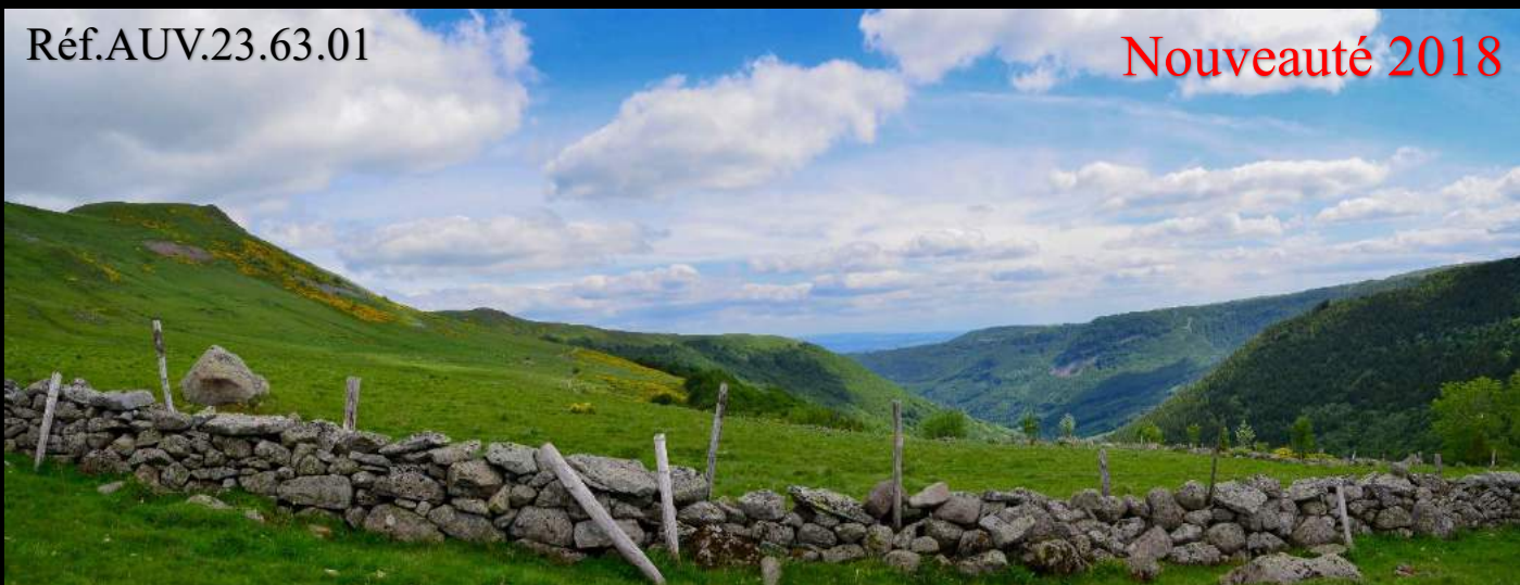
Vacherie de Grandval, près du Plomb du Cantal.