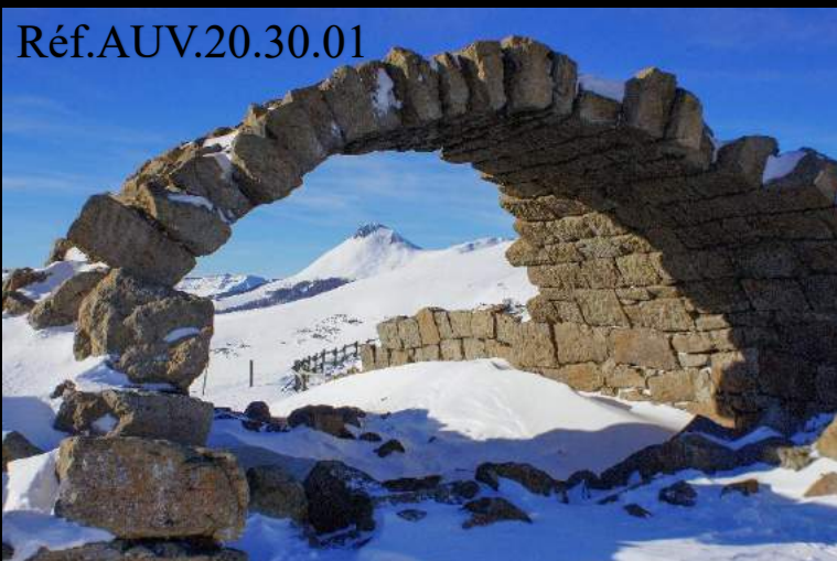
La Puy Griou depuis Le Lioran.