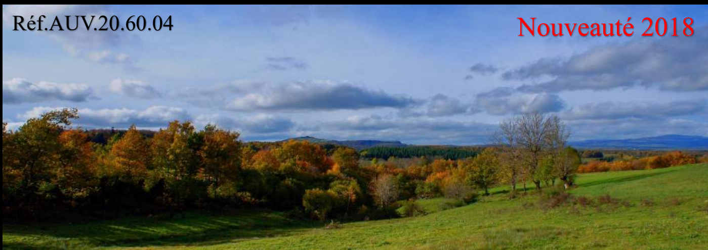
Couleurs d'automne sur les Monts du Cézallier (Puy-de-Dôme)