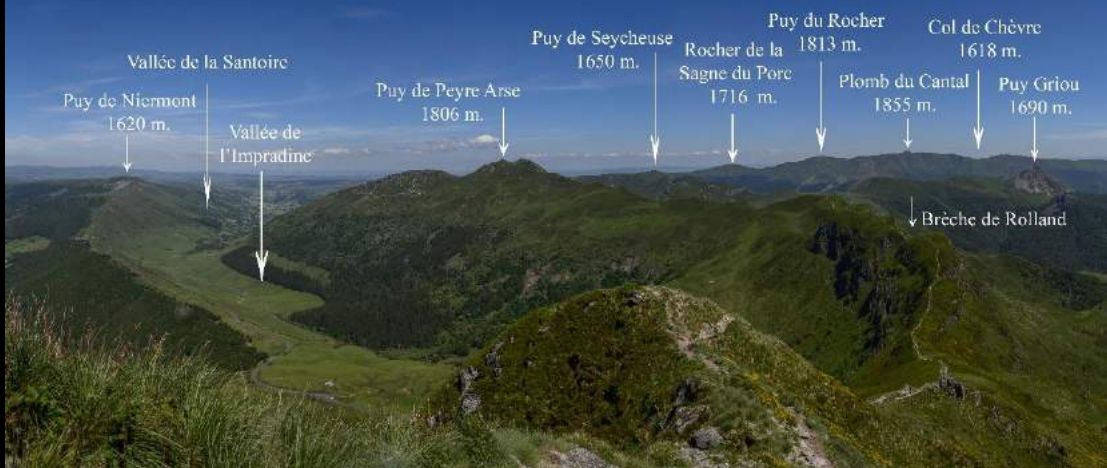
Panorama depuis le Puy Mary, Cantal