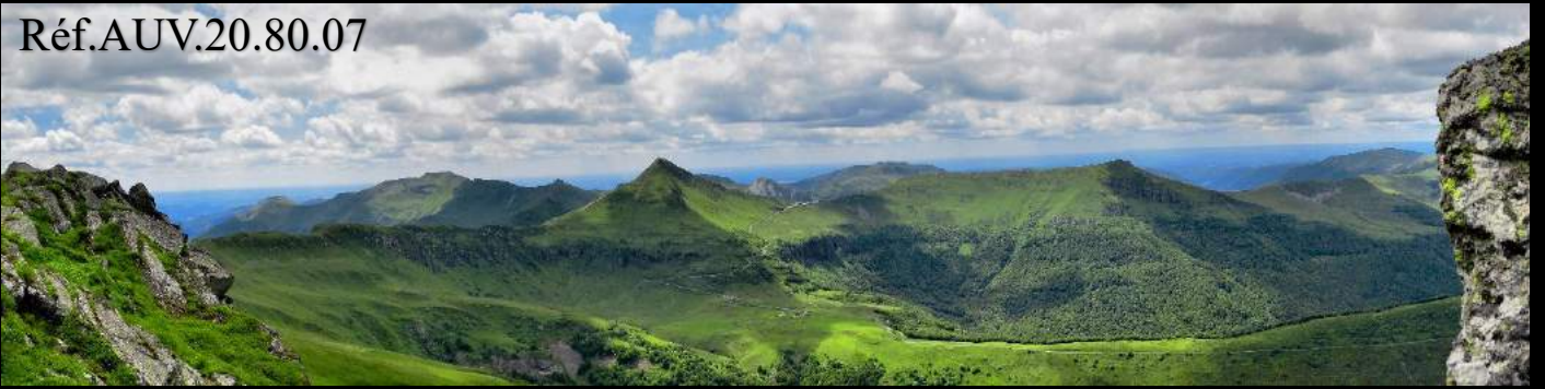
Le Puy Mary et les Monts du Cantal depuis le Puy de Peyre Arse.