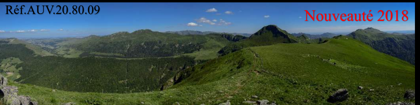
Le Puy Mary et les Monts du Cantal depuis le Puy de la Tourte (1704 m.)