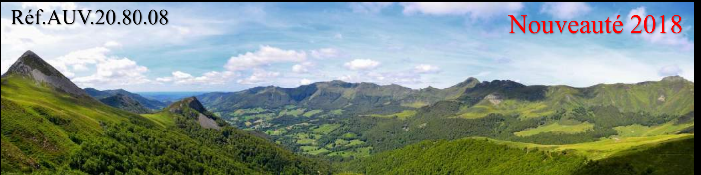
Le Puy Griou (1690 m.) et la vallée de la Jordanne (Cantal) depuis le col de Rombière.