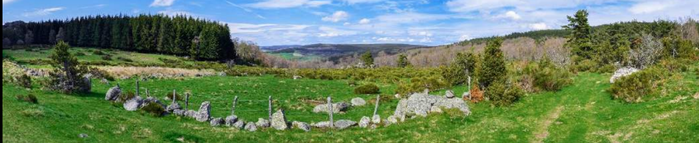
Le Truc de Randon, près du lac de Charpal, Lozère