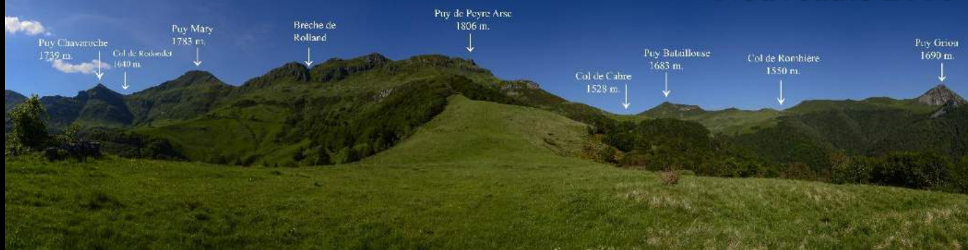
Panorama sur les Monts du Cantal depuis la vallée de la Jordanne