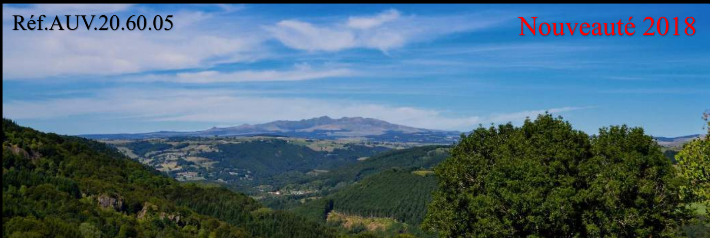
Le Puy de Sancy (1885 m.) point culminant du Massif Central.