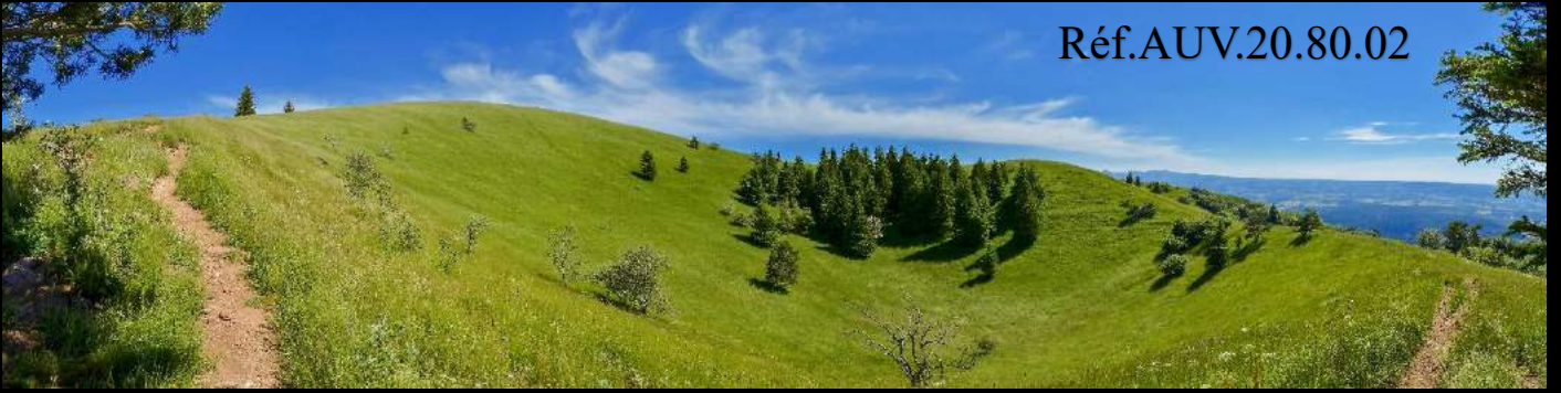
Le Puy de Côme