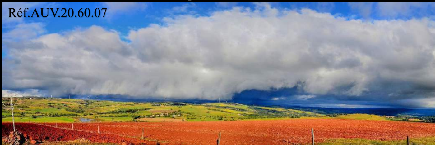
Les Monts du Cantal depuis le col de la Griffoul (1338 m.)