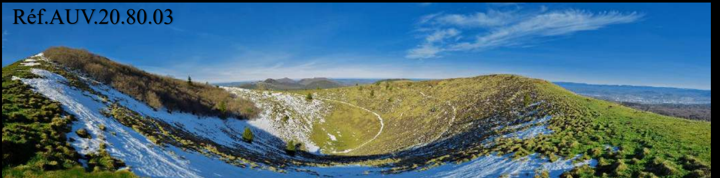
Le Puy Pariou