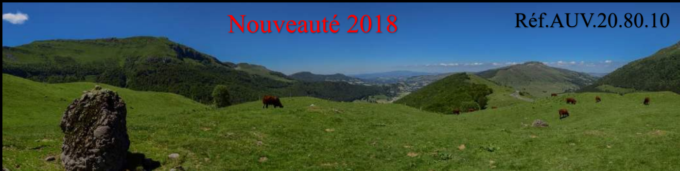
Vallée de la Rhue et vallée de la Santoire, depuis le col d'Eylac (Cantal)