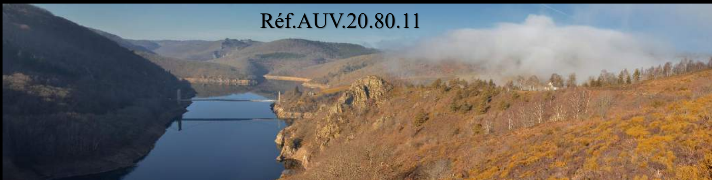
Pont de Tréboul sur la Truyère, près de Pierrefort (Cantal) et du barrage de Sarrans.