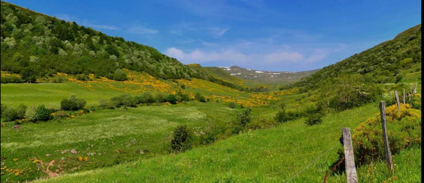
Le Plomb du Cantal (1855 m.) depuis la vallée de Brezons