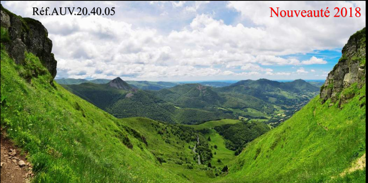
Le Puy Griou et les Monts du Cantal depuis la Brèche de Rolland.