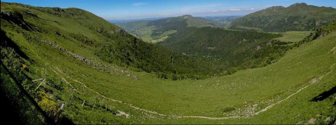
Panorama depuis le col du Pas de Peyrol, Cantal