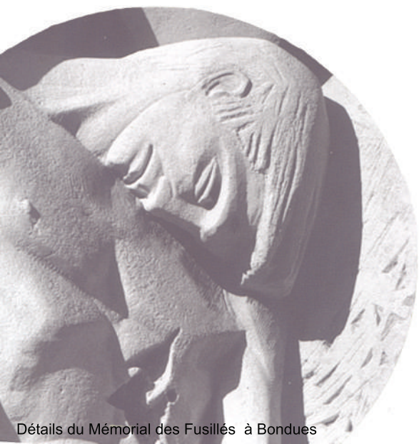
Détails du Mémorial des Fusillés à Bondues

CULTURE, OCCUPATION ET RÉSISTANCE EN BELGIQUE ET DANS LE NORD DE LA FRANCE