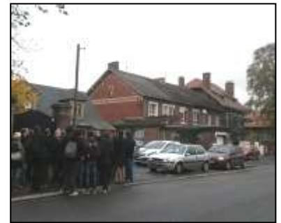
Vue sur les logements des instituteurs.

Après cette matinée scientifique et didactique, les participants ont effectué une visite sur le terrain. Guidés, ils ont pu (re)découvrir le patrimoine et les paysages de ce bassin minier. Une lecture de paysage des abords du quartier au départ du parking du stade Bollaert (actuellement en chantier pour l'Euro 2016) a permis en empruntant l'allée Foe d'observer les différents aménagements effectués autour du musée. La visite s'est poursuivie vers la cité minière n°9 qui jouxte l'ancienne Fosse, site actuel du musée. L'analyse paysagère de cet espace a donné l'occasion aux collègues d'observer un exemple de cité pavillonnaire traditionnel dont la hiérarchie urbanistique et organisationnelle est encore aujourd'hui visible par la conservation d'une grande partie du bâti (maison du directeur, maison du médecin, écoles, dispensaire, église et maisons de mineurs...). Enfin, arrivé au Musée, le groupe s'est dispersé pour profiter des différents services offerts par cette structure (expositions, conférence...).