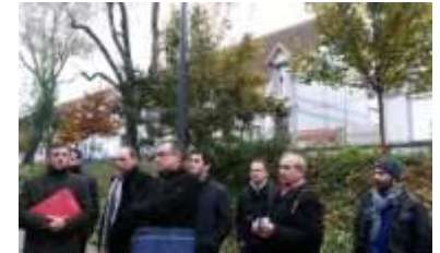
Devant une cité pavillonnaire.