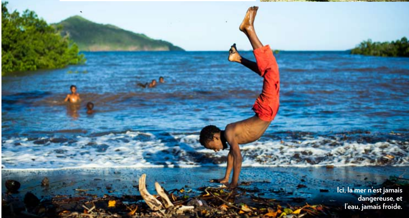
Ici, la mer n'est jamais dangereuse, et l'eau, jamais froide.