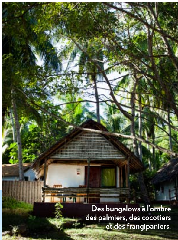
Des bungalows à l'ombre des palmiers, des cocotiers et des frangipaniers.

Chaque année, en face de l'hôtel, deux cents tortues cachent leurs œufs sur la plage.