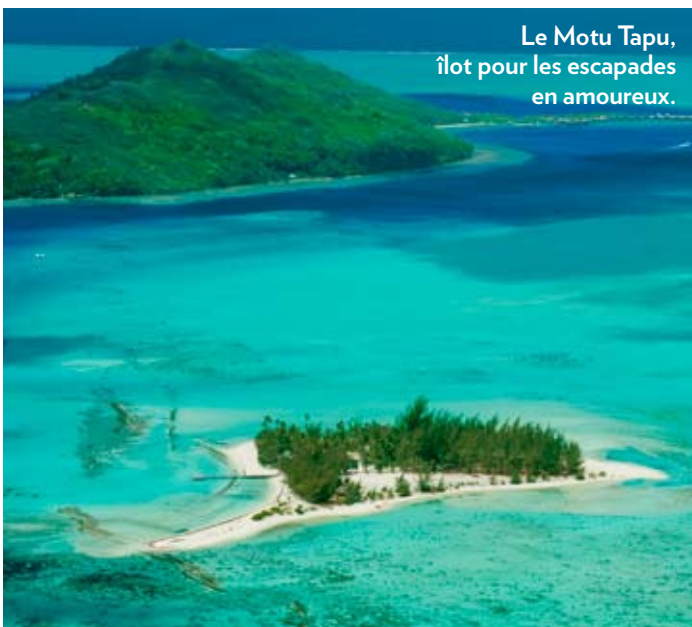
Le Motu Tapu, îlot pour les escapades en amoureux.

Dix jours et sept nuits avec vol aller-retour Paris/Papeete (via Los Angeles), les allers-retours inter-îles, une nuit à Tahiti à l'hôtel Manava Suite avec petit-déjeuner, six nuits au Hilton Bora Bora en suite avec vue sur le lagon, petit-déjeuner et taxes : à partir de 4 075 € par personne. Combiné dix jours et sept nuits au Hilton Bora Bora et au Hilton Moorea : à partir de 3 730 €. www.directours.fr . Offre valable du 1 er novembre au 10 décembre 2012.