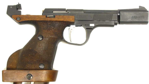
Pistolet 9 mm