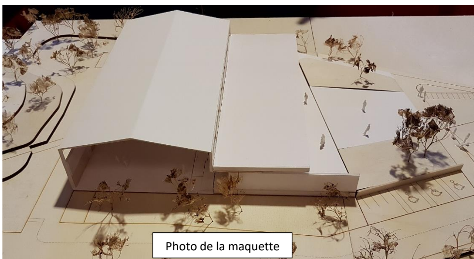
Photo de la maquette

Les bâtiments 1 670 000 € La démolition 132 000 € Les frais annexes 648 000 €