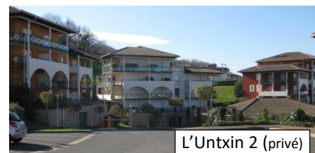
L'Untxin 2 (privé)