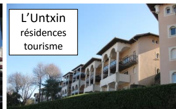
L'Untxin résidences tourisme

Et voici quelques chiffres : Ciboure 2012 : 6855 habitants - 6150 logements dont 2460 résidences secondaires (40%), et 307 logements vacants (5 %)