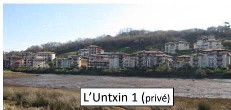
L'Untxin 1 (privé)