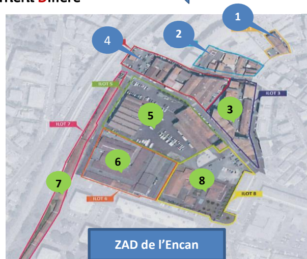
ZAD de l'Encan

Le 16 décembre 2015, les 3 zones dites "prioritaires" ont été définies : zones 1, 2, 4 rue Bourousse et Nivelles.