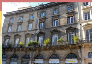
Automobile Club du Sud Ouest 8 Place des Quinconces 2ème étage - ascenseur