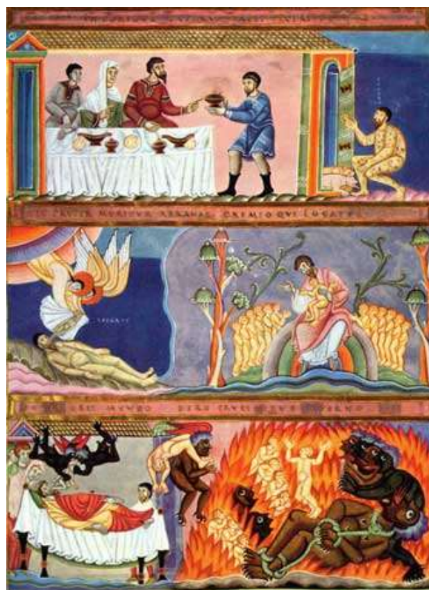
Enluminure du Codex Aureus d'Echternach

nous ne connaissons pas. Le Carême est un temps propice pour ouvrir la porte à ceux qui sont dans le besoin et reconnaître en eux le visage du Christ. Chacun de nous en croise sur son propre chemin. Toute vie qui vient à notre rencontre est un don et mérite accueil, respect, amour. La Parole de Dieu nous aide à ouvrir les yeux pour accueillir la vie et l'aimer, surtout lorsqu'elle est faible. Mais pour pouvoir le faire il est nécessaire de prendre au sérieux également ce que nous révèle l'Évangile au sujet de l'homme riche.