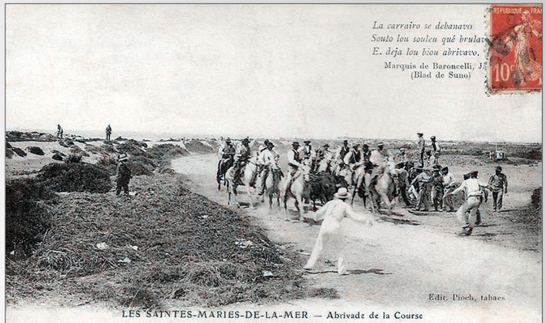
La carrairo se debanavo Souto lou souleu qué brulava E. de ja lou biou abrivavo. Marquis de Baroncelli, J. (Blad de Suno)

À l'origine, traversée au galop des taureaux de la course jusqu'aux arènes, encadrés par des gardians à cheval disposés en V. On disait aussi « la charge ».