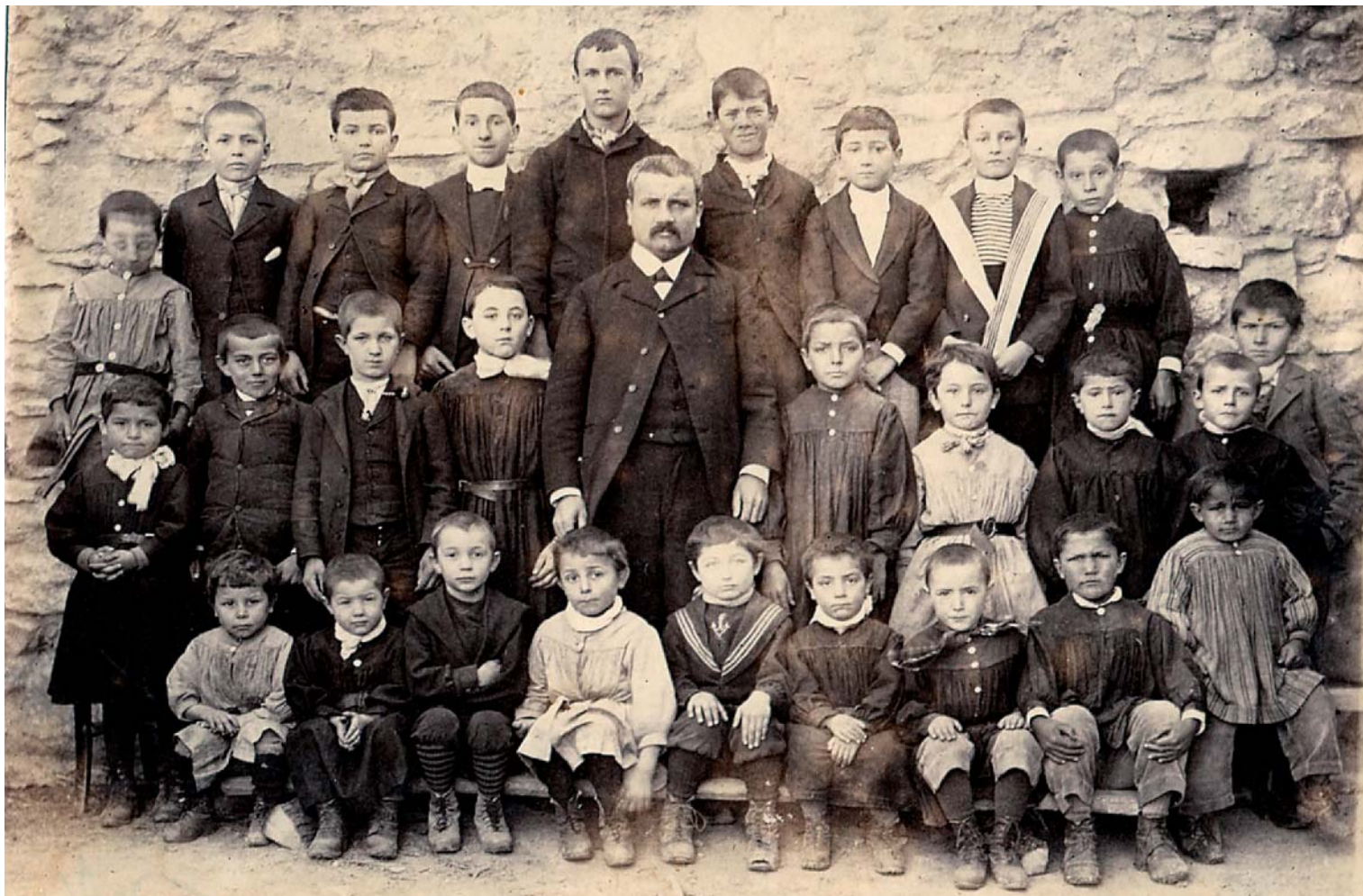
Classe de Piervert de 1897. Sur 27 élèves, 11 sont morts ou ont été blessés. 9 ne sont pas identifiés sur cette photo