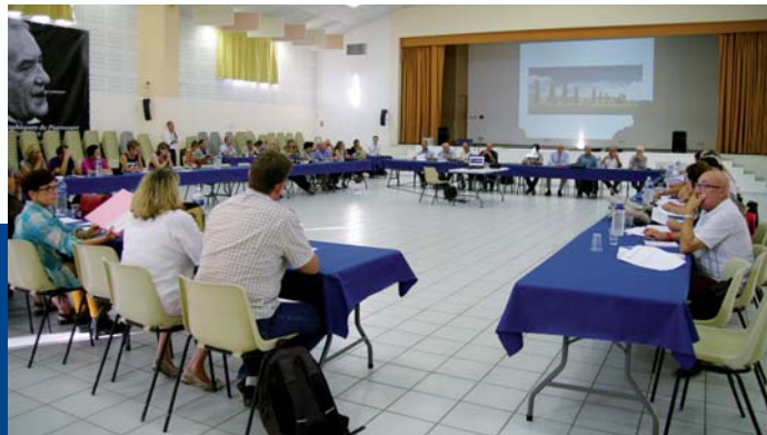
Pour la première fois de son histoire, le conseil communautaire de DLVA (Durance Luberon Verdon Agglomération) s'est réuni, le mercredi 3 septembre, dans la salle polyvalente de Pierrevert