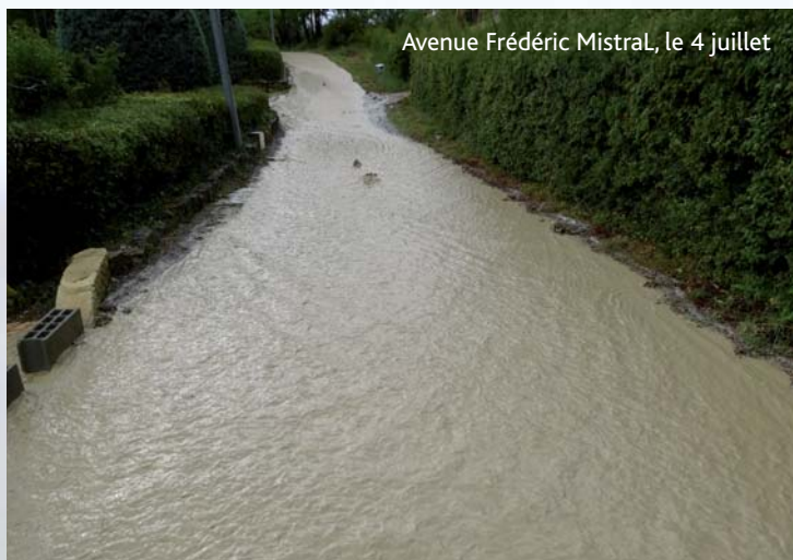
Avenue Frédéric Mistral, le 4 juillet