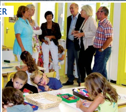
La rentrée scolaire pages 2-3