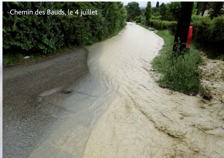
Chemin des Bauds, le 4 juillet

Lors d'un congrès international à Montréal au mois d'août, les spécialistes mondiaux du climat ont brossé un sombre tableau de la météo des prochaines décennies : la hausse des températures va avoir un effet amplificateur sur le climat actuel, avec des vagues de chaleur et périodes de sécheresse plus extrêmes, et des épisodes de grand froid plus marqués, « les nuages vont se former plus facilement, plus rapidement et les pluies vont être plus fortes, engendrant notamment davantage d'inondations soudaines ».