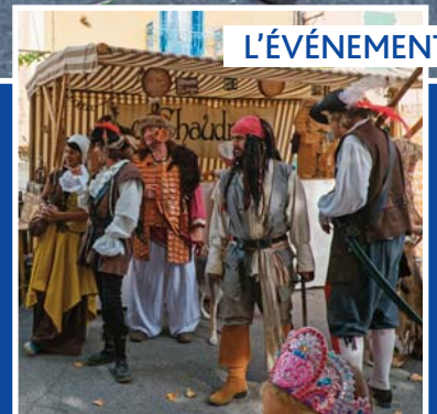
Les fêtes médiévales pages 10-11