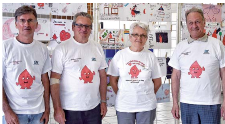
Pour connaître d'autres lieux de collectes : jedonnemonsang.net

C'est l'été, période sensible où la fréquentation des collectes baisse. Un appel urgent à la mobilisation des donneurs a été lancé à la veille de la Journée Mondiale des Donneurs de Sang. Après les grèves, les intempéries, les réserves de sang sont basses et la situation très fragile. Aussi, plus que jamais, chaque don compte. L'Établissement Français du Sang estime qu'une augmentation d'au moins 15% des dons est nécessaire pour faire face aux besoins des malades, mais aussi pour avoir la capacité de répondre à une demande accrue, voire de s'adapter à des situations de type attentat. Pour la collecte du mois de mai, 61 élèves avaient participé au concours de dessin proposé par l'Amicale. Les gagnants, choisis par le vote des donneurs de sang et des personnels EFS, sont : Inès Guérinel, Énola Batte, Jade Chastellas pour les cours du CM1, et Chloé Fournier, Anna Cornu, Ella André pour les cours du CM2. La prochaine collecte de sang de Pierrevert aura lieu le 14 septembre de 15 h à 19 h.