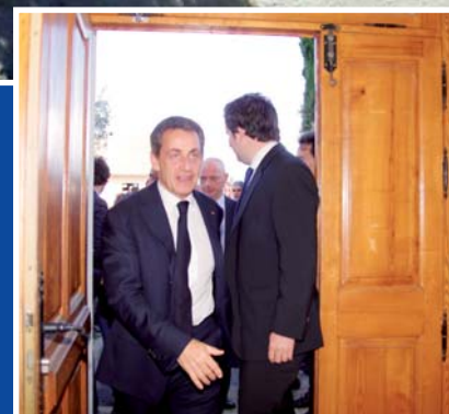
Nicolas Sarkozy à Pierrevert... (pages 4 et 5)