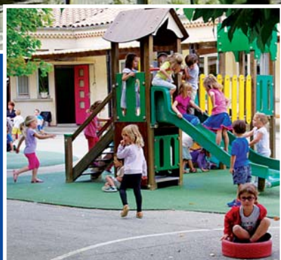
Notre dossier spécial écoles... (pages 8 et 9)