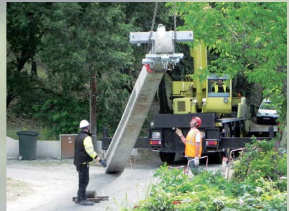
Pose d'un nouveau poteau ERDF de 5 tonnes

En prélude aux travaux prévus sur le pont des Rochs, le poste et le poteau ERDF, submergés lors des inondations du novembre 2011, ont été récemment remplacés, éloignés de quelques mètres des berges et rehaussés.