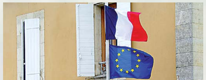
Les anciens drapeaux, en lambeaux, ont été remplacés

Aussi, la somme de 880 000 € a dû être inscrite en prévisionnel pour équilibrer la section d'investissement pour le budget 2014.