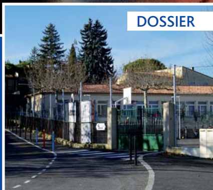
Les nouveaux rythmes scolaires pages 4-5