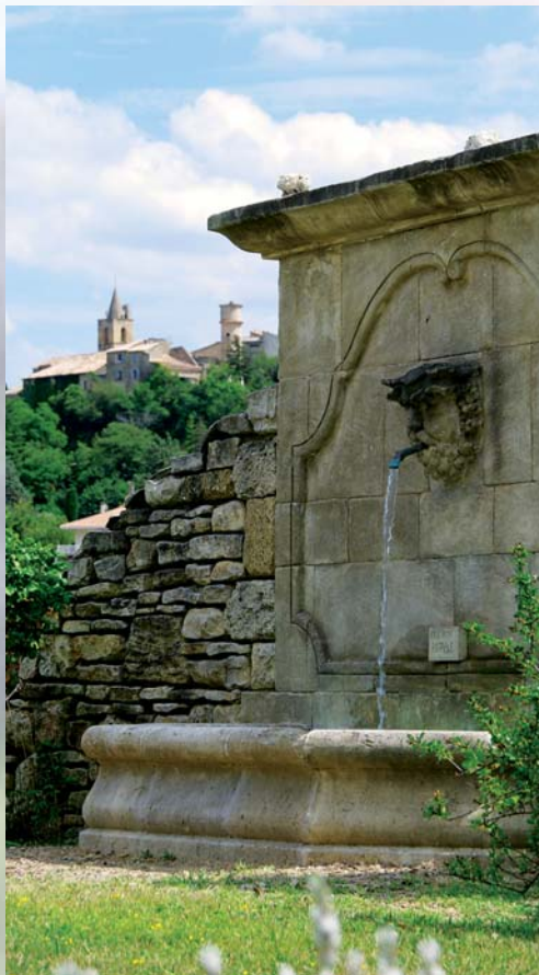
L'eau coule à nouveau dans la fontaine du rond-point Saint-Joseph

technique pérenne et financièrement acceptable. Un appel d'offre a donc été lancé en partenariat avec DLVA pour une étude thermique avec solutions d'économies d'énergie. En fonction de notre choix nous pourrions rechercher et obtenir une subvention.