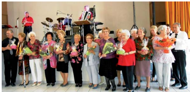
Lors des 35 ans du Club, les anniversaires et les nonagénaires ont été fêtés

Au programme cet été : voyage en Vendée du 22 au 29 juin ; pique-nique autour de la chapelle Saint-Patrice avec grillades et jeux de boules ou de société le 3 juillet ; repas dansant avec l'aïoli le 11 septembre ; sortie en bateau-mouche sur le Verdon et repas au casino de Gréoux-les-Bains le 25 septembre.