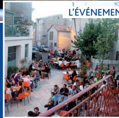
La fête de la musique 2014 page 23