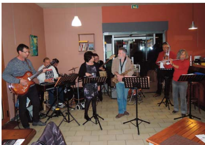
Animation musicale au Bacchus le 5 décembre, pour le Téléthon