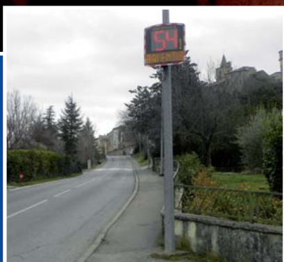
Nos routes sécurisées (page 5)