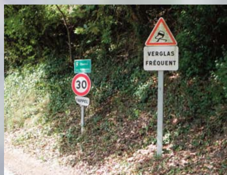
Chemin des Ferrages avant et après un regroupement de panneaux

Un budget important devra donc être prévu pour effectuer le remplacement de tous ces panneaux illisibles ou tagués. En attendant de disposer de ce budget, un plan global de rationalisation de la signalisation verticale a été lancé sur l'ensemble des panneaux déjà en place : des mâts dépourvus de panneaux en bordure de route ont été enlevés et récupérés, des panneaux ont été regroupés sur un seul mât pour limiter la pollution visuelle et améliorer la rationalité de notre système de