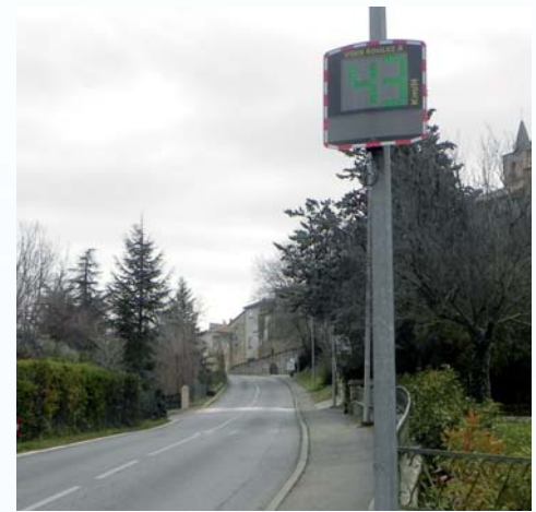
Installation de 3 radars indicateurs de vitesse aux entrées principales du centre-village

En effet, ces aménagements ont coûté 32 000 € TTC, et ont été généreusement subventionnés par nos Conseillers départementaux, avec près de 18 000 €, dont