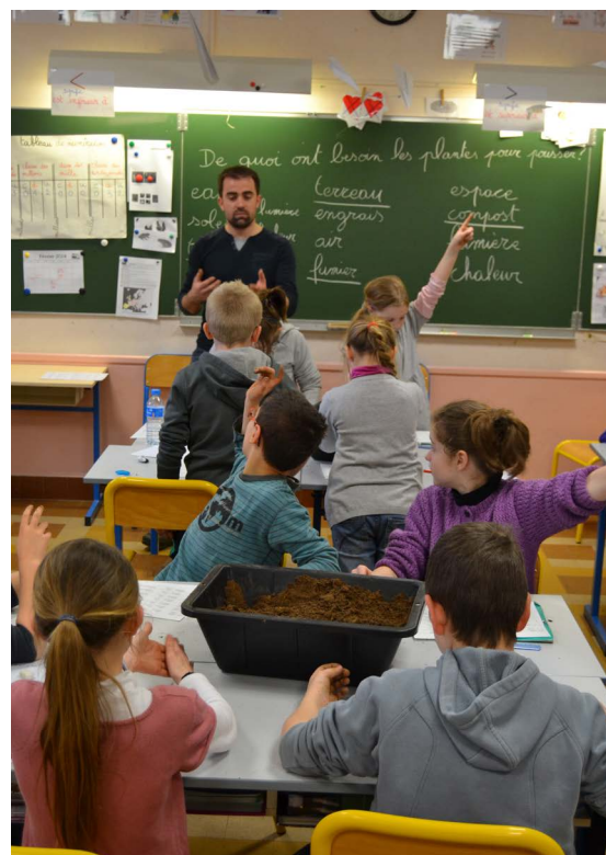
Le Parc finance les interventions en classe.

Chaque année, le Parc naturel régional du Perche propose et coordonne une offre d'animations pédagogiques gratuites pour les écoles de son territoire. Cette année, ce sont ainsi 80 classes qui vont pouvoir en bénéficier.