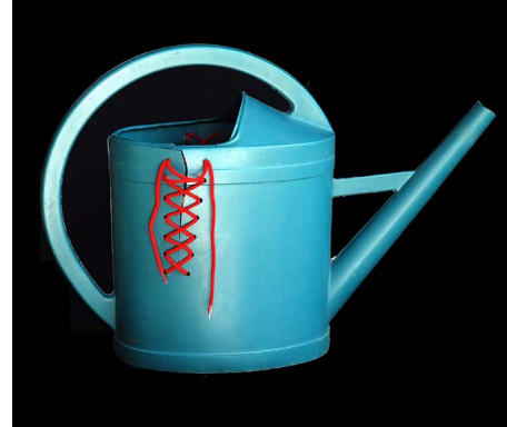
Les matières plastiques sont ce que nous en faisons...

Le 2 e des trois ateliers-débats proposés par le Parc dans le cadre de l'exposition «Errances plastiques», de Claude Imhof, abordera le thème des matières plastiques.