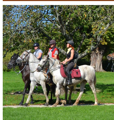
Des racines et des ailes a mis en lumière le tourisme équestre dans le Perche.

L'émission « Des Racines et des ailes » avait choisi l'angle de la randonnée équestre pour traverser le Perche et présenter ses charmes aux téléspectateurs. Si des circuits existent et de nombreux gîtes accueillent cavaliers et montures, cette offre touristique reste à développer. C'est pourquoi les Comités départementaux de tourisme équestre (CDTE) de l'Orne et de l'Eure-et-Loir se sont rapprochés du Parc naturel régional du Perche.