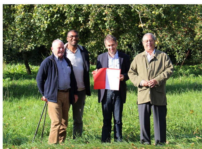
Un contrat-type souple et simple est mis à disposition gratuitement des propriétaires.

« Nous voyons aujourd'hui que beaucoup de propriétaires de vergers, parfois des résidents secondaires, ne sont plus intéressés par la production de leurs pommiers à cidre, ou n'ont pas le temps de s'en occuper »,