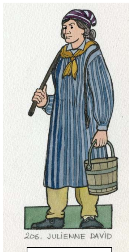
Illustration de Jean Bruneau

Le troisième fut définitif, elle n'avait que 65 ans 10 mois 5 jours, l'état-civil lui donnait 70 ans.