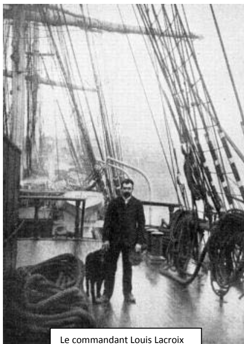
Le commandant Louis Lacroix sur le Babin Chevaye en 1907

Square Commandant Lacroix situé rue de l'Hermitage, entre les numéros 10 et 20.