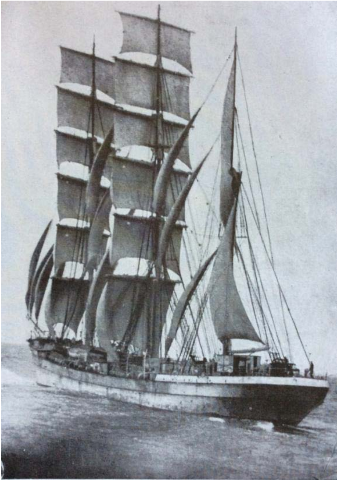
Le BABIN-CHEVAYE descendant le Canal de Bristol par vent contraire.