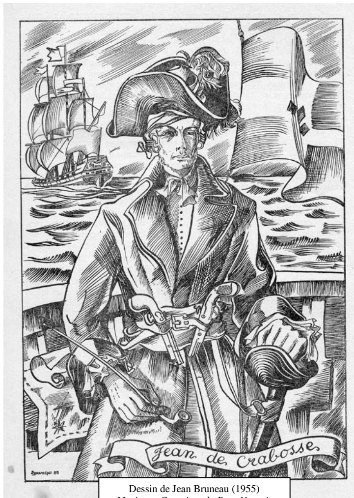
Dessin de Jean Bruneau (1955) « Marins et Corsaires du Pays Nantais »

La prise de « l'Espérance » avec poursuite, esquivé, abordage, combat, est digne des romans d'aventure. Sa devise serait « Ne craint ni plaie ni bosse ! »