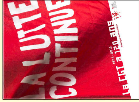
Catalogue de l'exposition 82 pages Prix unitaire : 15 €uros