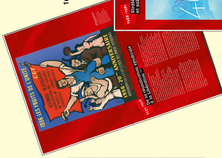
Exposition 16 panneaux - format 65 x 100 cm Plastifiée - 4 oeilllets Prix unitaire : 270 €uros