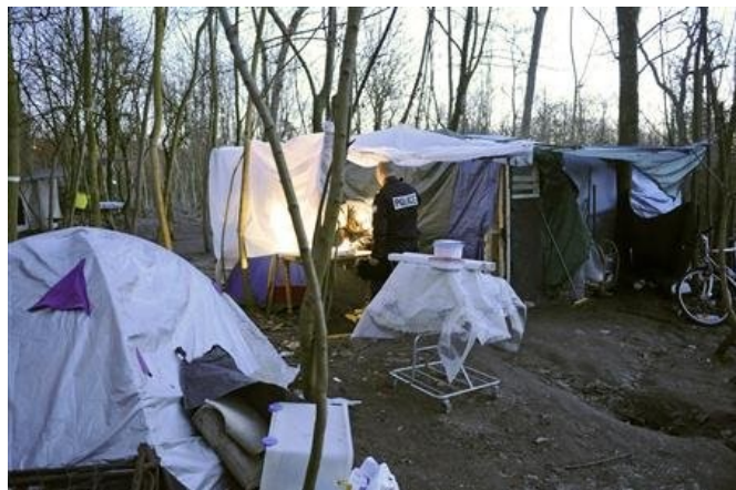
Perdre son logement devient une des inquiétudes principales des Français

Le 31 mars prochain sonnera la fin de la trêve hivernale pendant laquelle les expulsions locatives sont interdites.