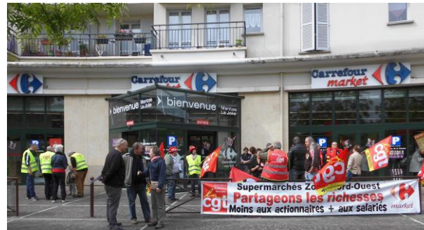
Les « Carrefour-Market à Mantes-la-Jolie le 23 mai 2015

Cette politique fait le jeu de l'extrême-droite qui, chaque jour, profite un peu plus du désarroi politique qu'elle produit.