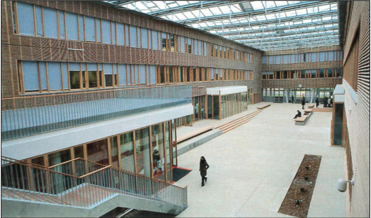
Doc. 4 : L'engagement à l'échelle régionale. (Lycée Kyoto de Poitiers, premier lycée européen 100% énergies propres *, construit par la région Poitou-Charentes (actuellement Nouvelle-Aquitaine) en 2007.