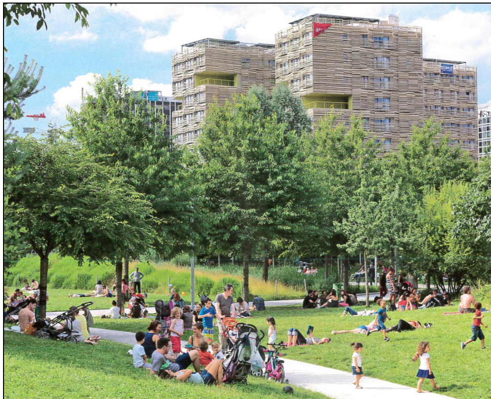
Doc. 2 : La construction de nouveau quartier.

(le parc Martin-Luther-King dans l' éco-quartier * Clichy-Batignolles, à Paris)