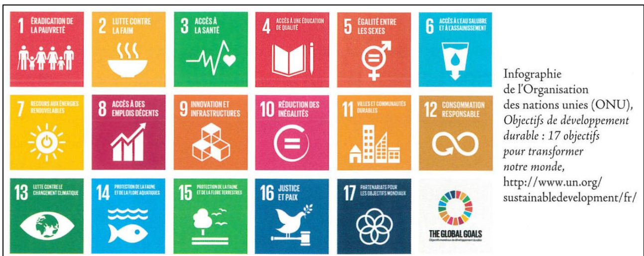
Doc. 5 : L'engagement à l'échelle internationale. En septembre 2015, 193 pays de l'ONU ont fixé 17 objectifs à atteindre en 2030 pour agir en faveur du développement durable.