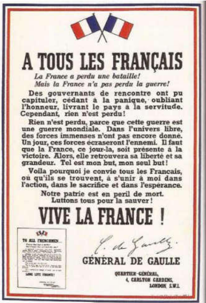
1 L'appel du 18 juin 1940 du général de Gaulle