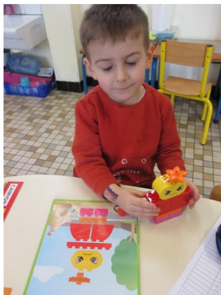
Je construis un animal Duplo en regardant un modèle : j'apprends à trouver les pièces, à les disposer comme sur le modèle et à les emboîter.