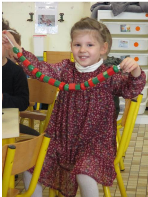
Je fais un collier de perles en algorithmme.